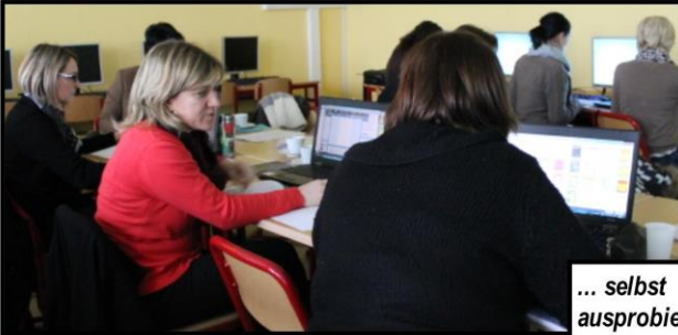
... selbst ausprobieren